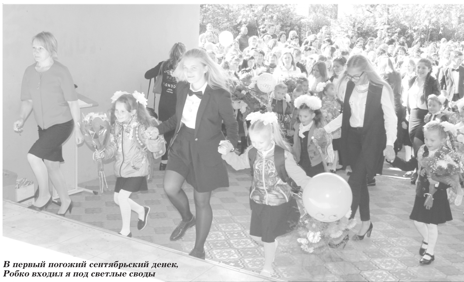
В первый погожий сентябрьский денек, Робко входил я под светлые своды

Большесельская школа может гордиться своими не только бывшими,